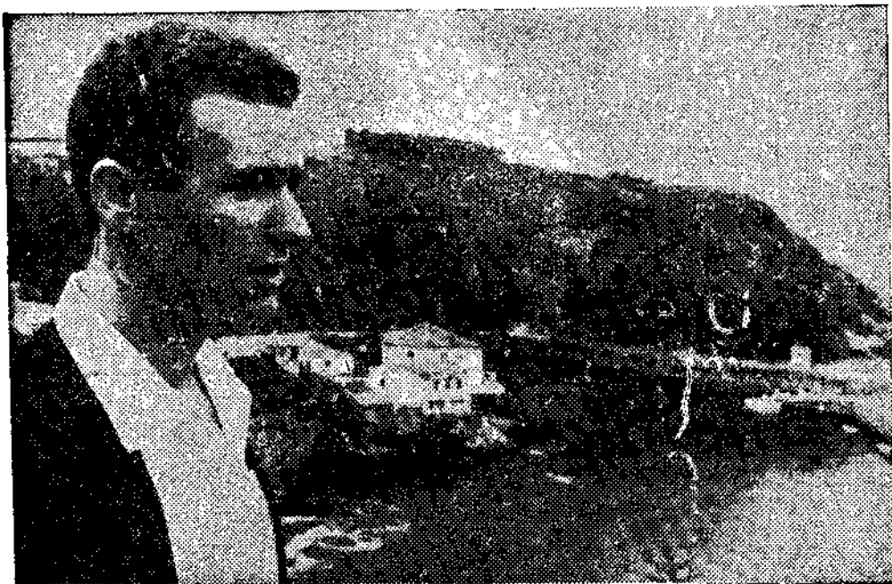
El capitán de barco más joven de España.

JUAN DE LILLO y JOSE VELEZ, enviados especiales