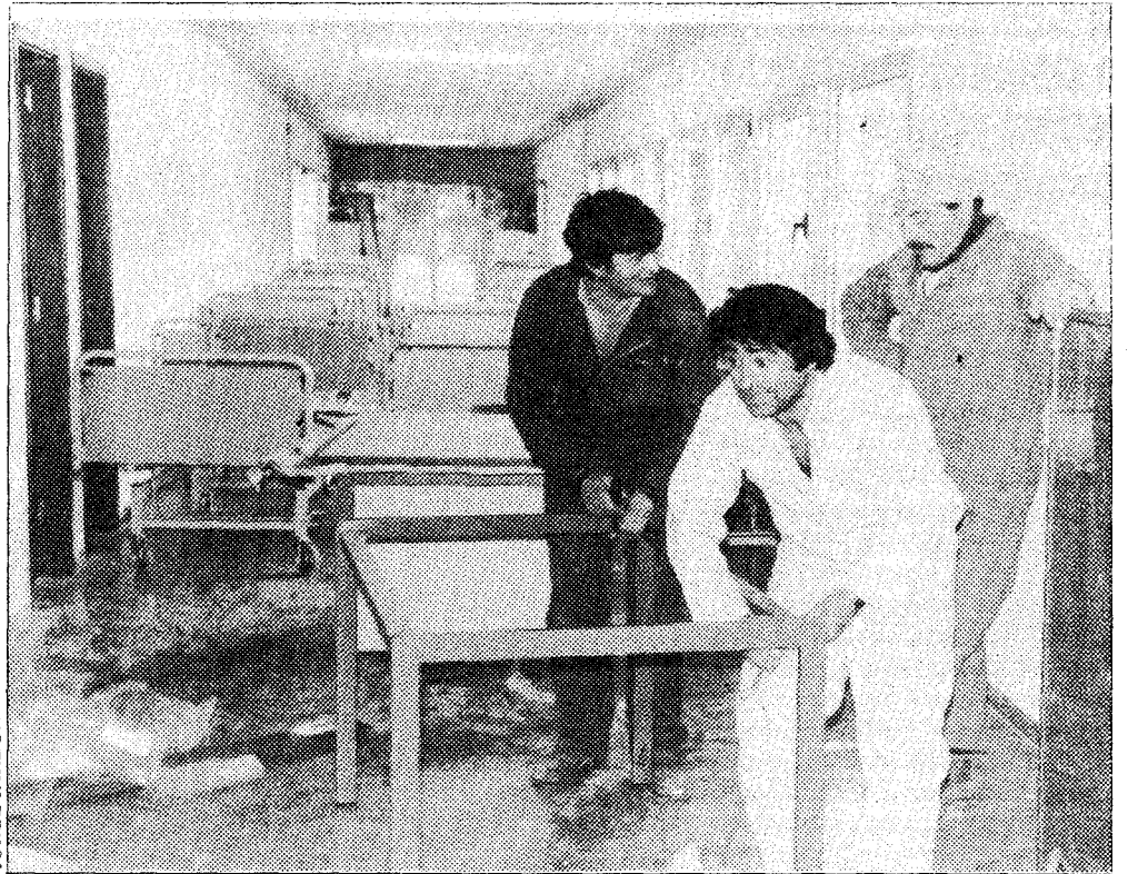
Los empleados se afanan en el montaje de camas y en los últimos remates a la instalación.

El 20 de febrero se abre la primera consulta externa del hospital, lo que marcará un hito histórico en la comarca