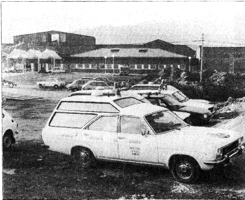
Las ambulancias ya han llegado al hospital. Ha sido el más madrugador de los servicios.

Los más madrugadores parecen haber sido los del servicio de ambulancias y los de la funeraria. Se han creado dos cooperativas para realizar estas funciones y resulta sorprendente que desde hace un tiempo permanecen ya colocadas a pie de obra a la espera de un primer servicio que hasta el día 20 no va a tener posibilidades de existir. Y para que no falte nada, el Hospital de Jarrio ya tiene incluso su cuenta bancaria produciendo intereses. Hace unos 15 días que en la Caja de Ahorros ya fue abierta la cuenta hospitalaria con tres