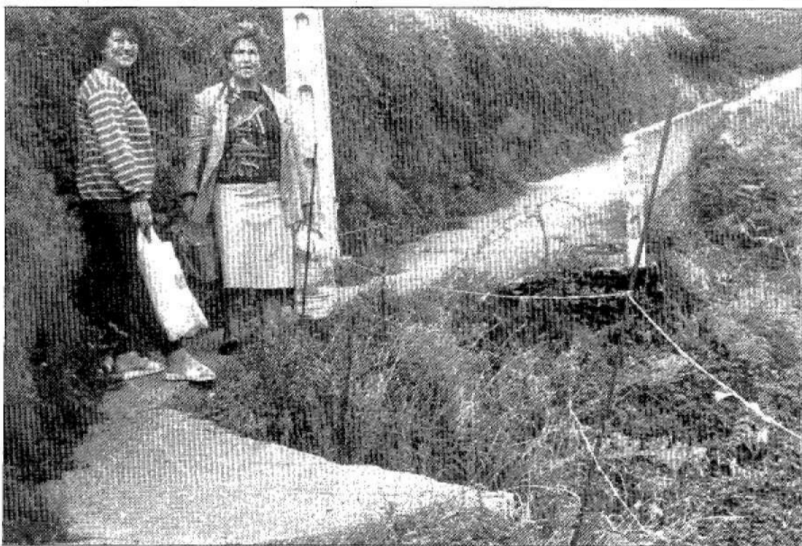
Dos vecinas de La Cabana, al pie del peligroso camino que conduce a sus casas.

Para tapar toda esa inmundicia se construyó todo alrededor un muro de más de un metro, con lo que el desnivel es de tal naturaleza que ha sido necesaria construir tres escalones para entrar en el interior del prado. El relleno echado sobre el acantilado ha aproximado todo tanto que los desagües de las viviendas coinciden justo al lado del camino.