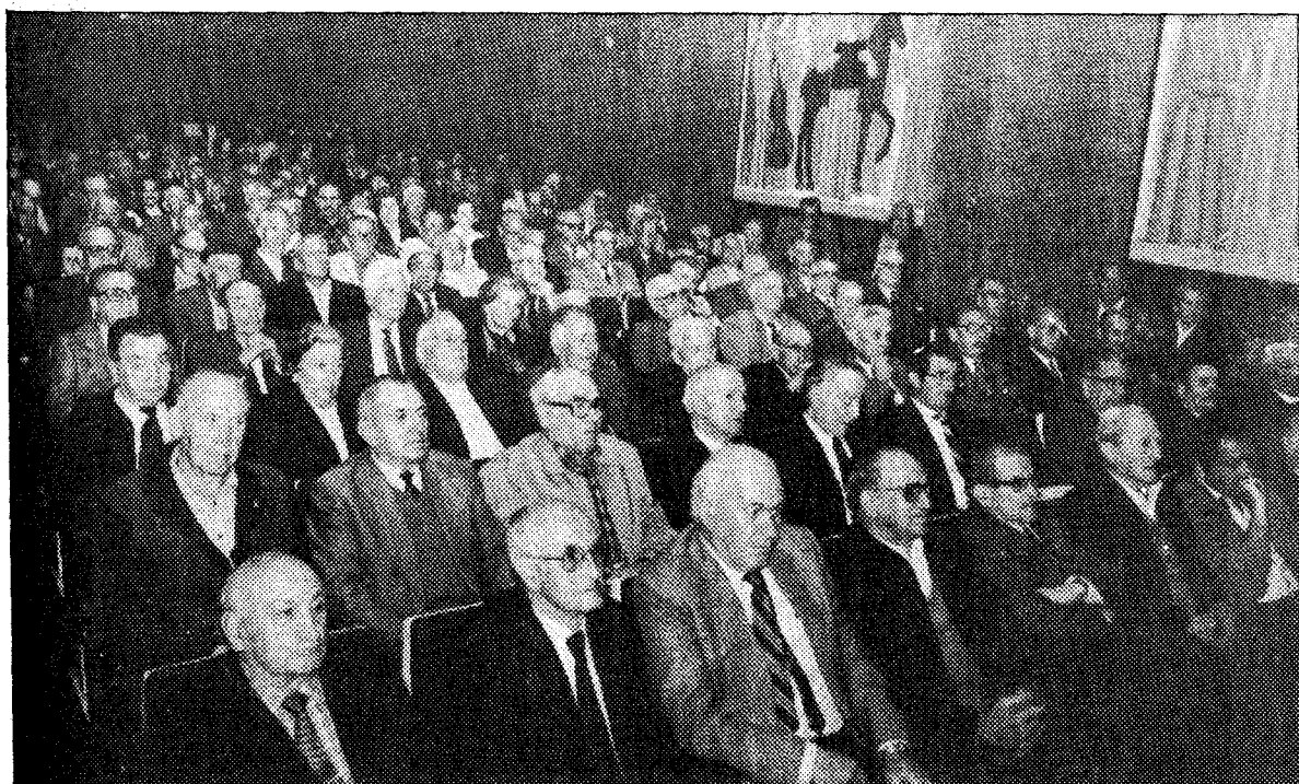
Un aspecto de la asamblea de ex combatientes republicanos celebrada ayer en Oviedo. Su reivindicación fundamental sigue siendo el reconocimiento de sus derechos.

Esta piscifactoría, que es la primera industria que se establece en la historia de San Tirso de Abres, está actuando como agente motivador en el concejo. En estos momentos, el Alcalde está haciendo gestiones con industriales asturianos y gallegos para establecer una importante industria relacionada con la madera y con capacidad para unos treinta empleos. Y para ampliar las posibilidades de este abandonado municipio, «desconocido incluso para los consejeros», el Ayuntamiento está tratando de ampliar el polígono industrial hasta los 20.000 metros.