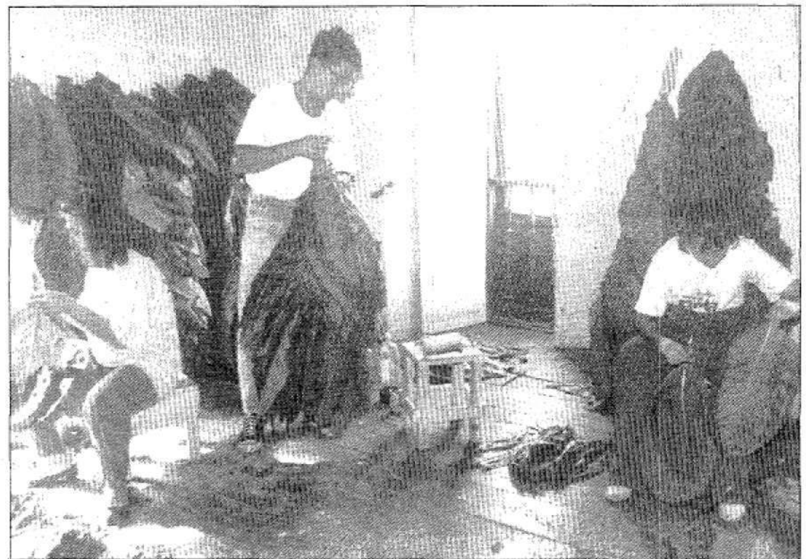
Los primeros resultados demuestran que la experiencia resultó muy positiva.