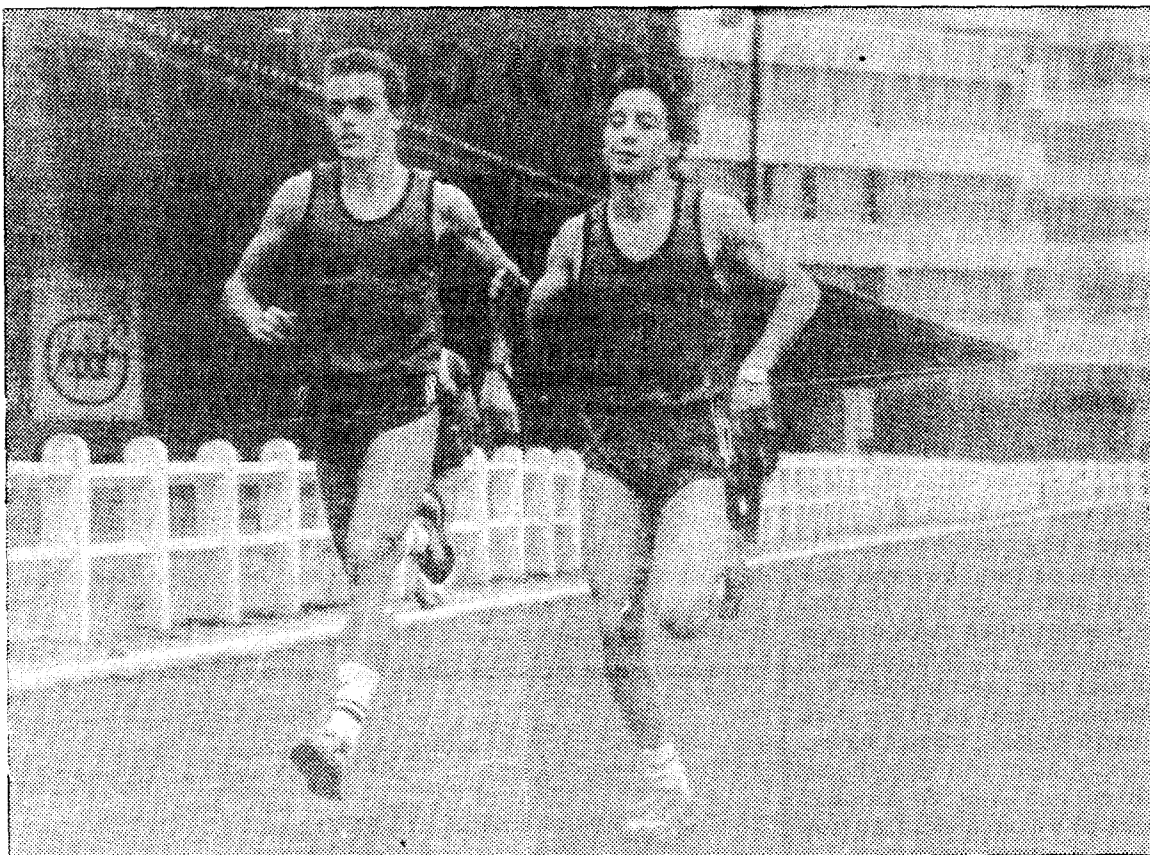
Las nuevas pistas de Los Catalanes estarán listas para el próximo curso.

Asimismo se ha llegado a un preacuerdo para completar el campus deportivo de Los Catalanes en el que también se incluirán un polideportivo, una cancha de tenis, una bolera asturiana y una pista finlandesa. En total, la inversión es de 150