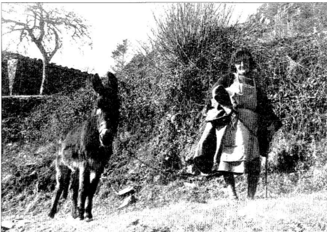
Una de las vecinas de Ferreira, una localidad sin señalización alguna.