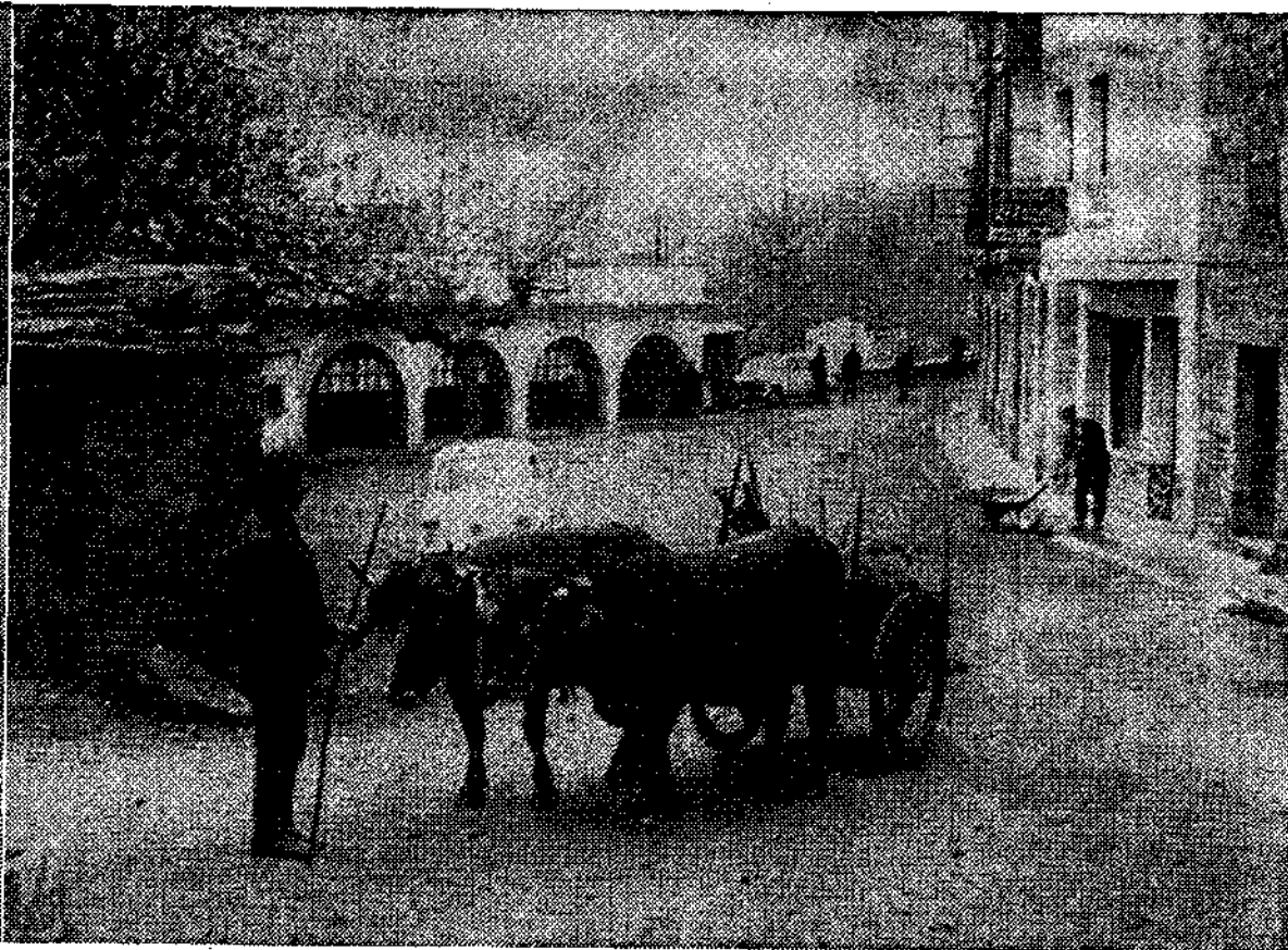
Plaza de abastos y mercado de Santa Eulalia.