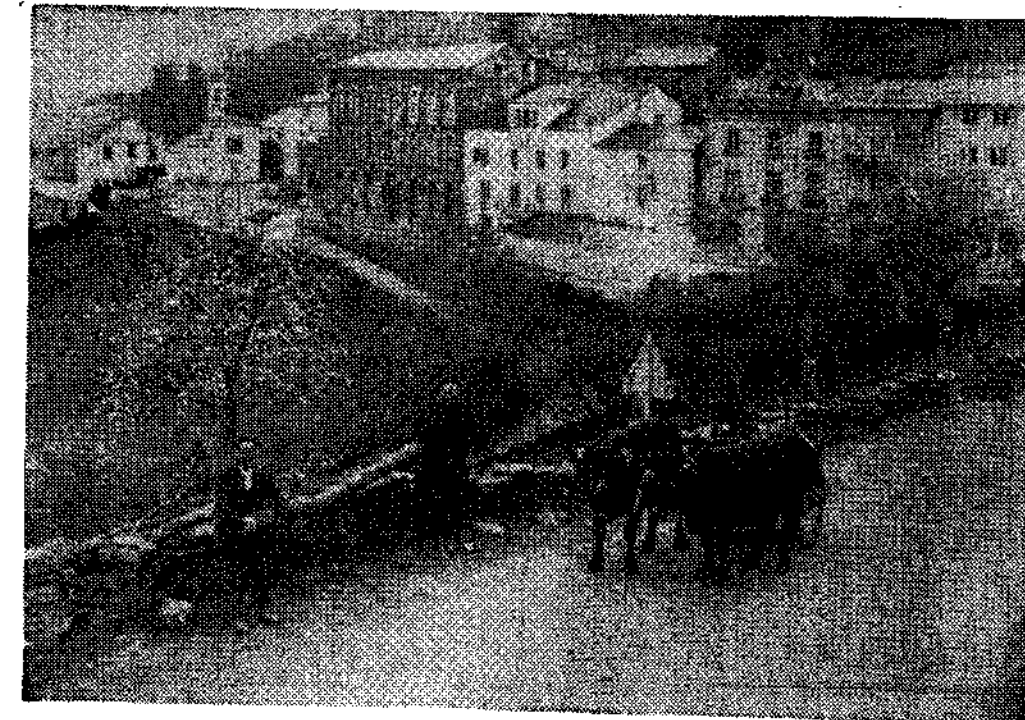
Santa Eulalia, capital.

El primer domingo del mes de septiembre se celebra San Roque. Son tres días ininterrumpidos de jolgorio, y aquí