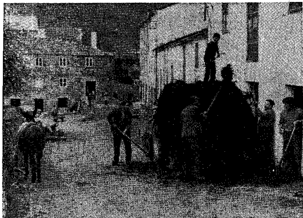
Cargando «cucho». (Santa Eulalia.)

acuden gentes de los más diversos lugares de Asturias y Galicia.