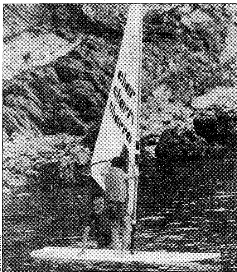
Un monitor enseña a mantenerse en la tabla a un joven que participa en las actividades de Castropol