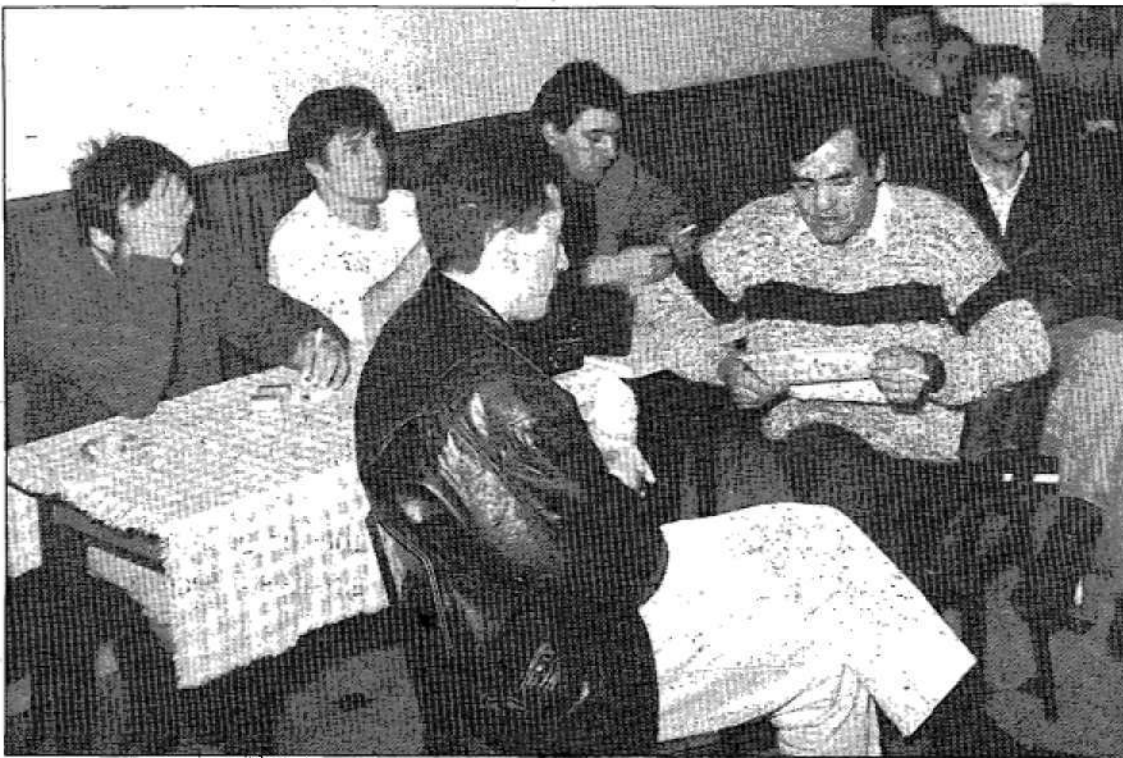
Un momento de la asamblea de los vecinos de Tormaleo.