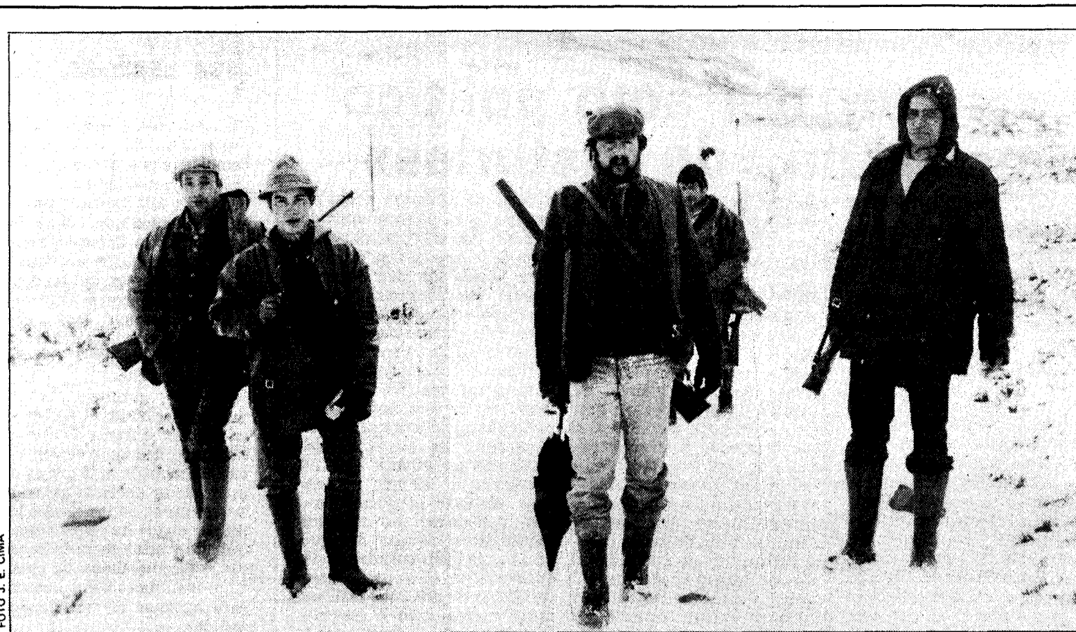
La Consejería de Agricultura prefiere métodos selectivos de control de las poblaciones de lobos en vez de las indiscriminadas batidas. La figura de los cazadores en pos de los lobos puede desaparecer

Una vez se fijen las demarcaciones de los Juzgados y entren en funcionamiento éstos, los ciudadanos de Langreo no tendrán que acudir a Pola de Laviana para resolver los asuntos pendientes con la justicia y posiblemente, según las previsiones existentes, podrá contar con un servicio más amplio que el del actual Juzgado.