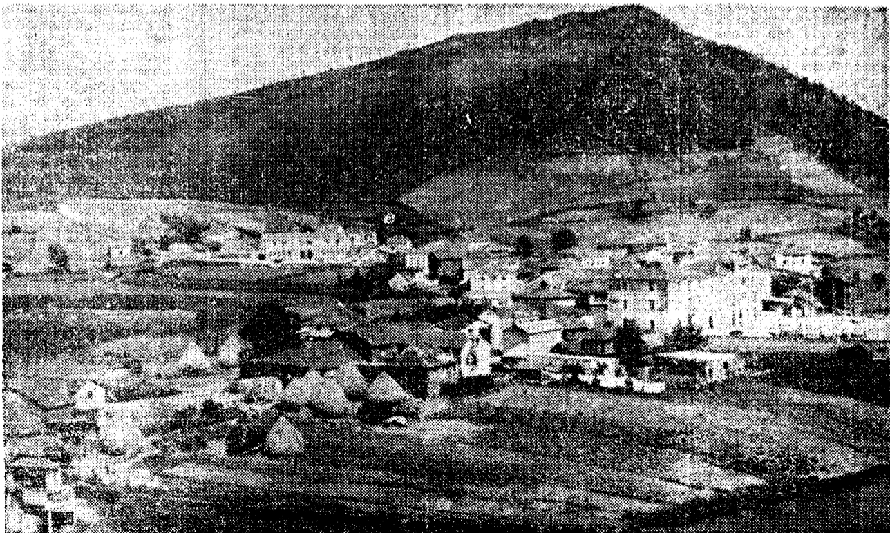
Capital del municipio de Villayón

El alcalde de Villayón señala también la gran necesidad que tiene el concejo de alguna pequeña industria para que la mano de obra joven tenga donde ocuparse. La riqueza forestal podría ser una salida pero «los incendios han destruido más del 90 por ciento de los montes del municipio tanto los particulares como los consorciados con ICONA». En cuanto a la instalación de industrias de la madera no hay tampoco posibilidades porque el pino y el eucalipto de Villayón —el que se consigue cortar antes de que se quemé— va directamente para la fábrica de Navia.