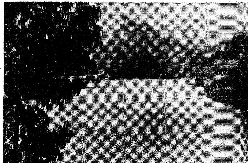
Pantano de Arbón: Ahora hay que repartir el canon con otros Ayuntamientos