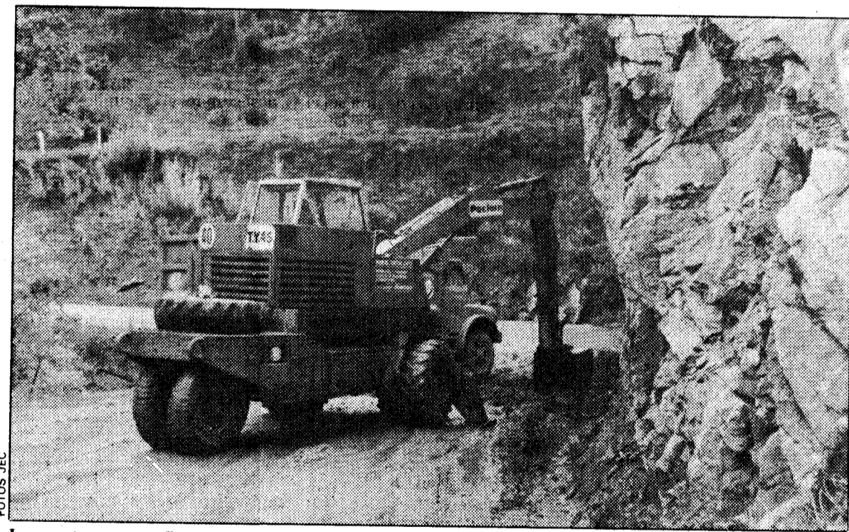
La carretera es, por fin, una realidad, después de muchos años de espera

El otro reto para Saliencia y sus alrededores es la construc-