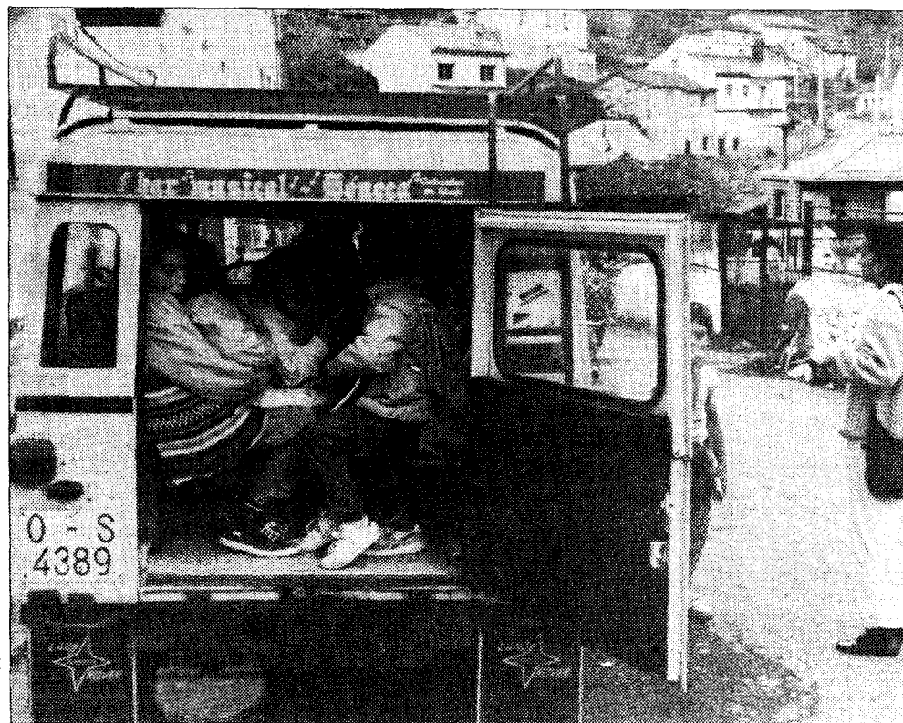
Los alumnos, en el vehículo todo terreno que los llevaba a sus casas al no quedarse en la escuela hogar.

Padres de los alumnos de la escuela hogar decidieron ayer que sus hijos vuelvan al centro después de que se adecentasen las camas