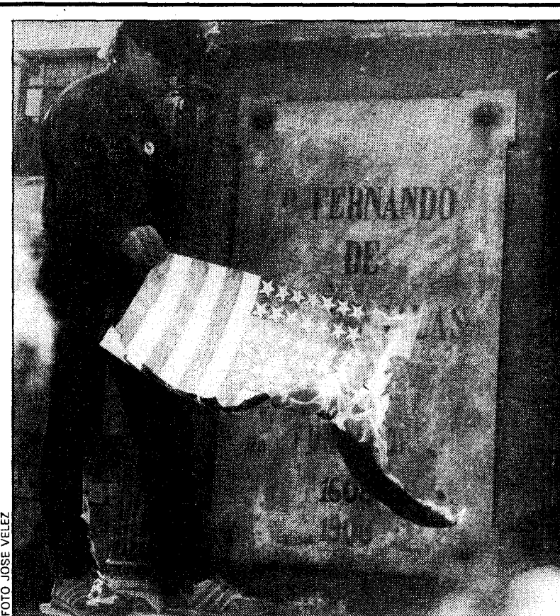
Un manifestante quema una bandera norteamericana en el patio de la Universidad de Oviedo

Los actos contra la estancia de Reagan en España continuaron en diversos lugares de Asturias en la tarde de ayer, y hoy habrá más, con un «juicio» público al presidente americano en Oviedo, plaza del Ayuntamiento, y en el que intervendrán los colectivos teatrales «Margen» y «Güestia». En Gijón, se organizará una «foli-