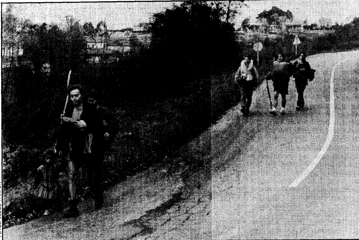
A las diez de la mañana se inició la ruta dejando atrás Cudillero. La nueva jornada contaba con veinte kilómetros

3.º De acuerdo con lo anteriormente indicado, no procede hacerse abono alguno a cuenta de la instalación de teléfonos a personas o personas físicas.