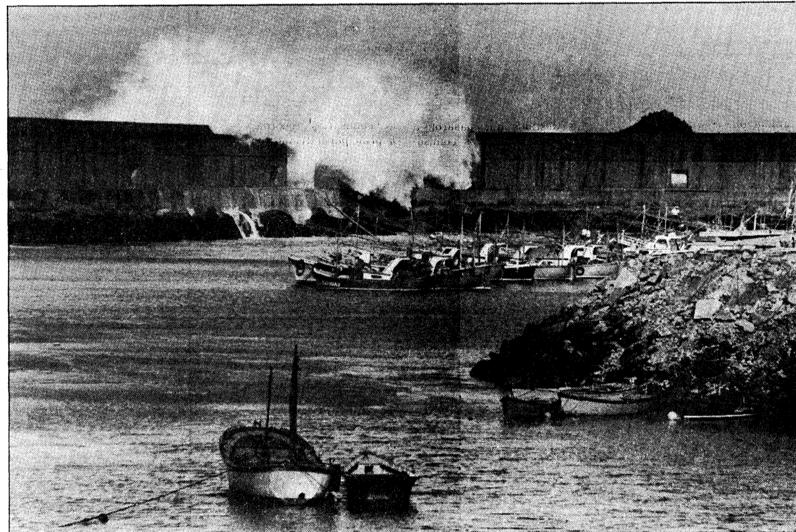
La mar entra por el boquete abierto en el nuevo muelle de abrigo del puerto de Cudillero, donde los problemas de cimentación eran notorios

dado el estado del mar. Los barcos de mayor tonelaje estaban amarrados en el puerto de Avilés, ante la imposibilidad de hacerlo por el momento en Cudillero.