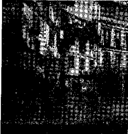
Muchas mujeres están deseando que mueran los maridos para coger el Montepío. ¡Hombre, van a decirme ahora a mí!

se. Pero en fin, eso son cosas particulares, que no vienen al tema.