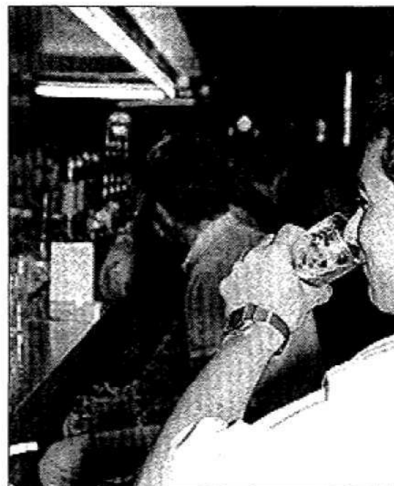
F. OTERO / NACHO VELA

A la izquierda, jóvenes mieresenses en un bar de moda de esta localidad. Sobre estas líneas, un establecimiento de Oviedo.