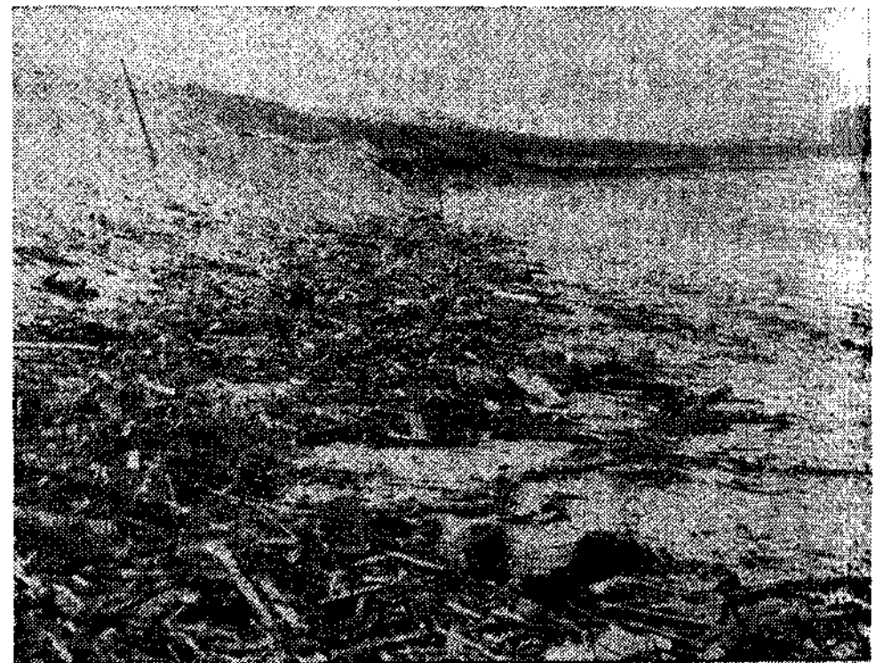
Playa del Espartal (Castrillón)

Y hasta el próximo día 23 permanecerá abierta al público la muestra del artista asturiano Bernardo Sanjurjo que se ofrece en la Casa Municipal de Cultura.