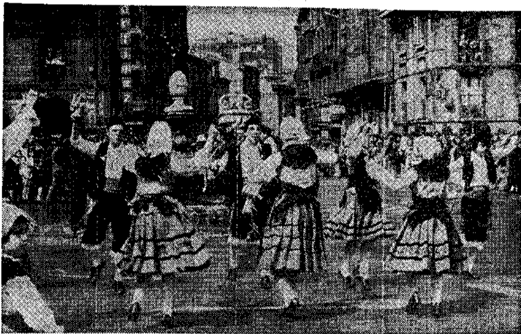
Un grupo folklórico asturiano actúa en la plaza de España