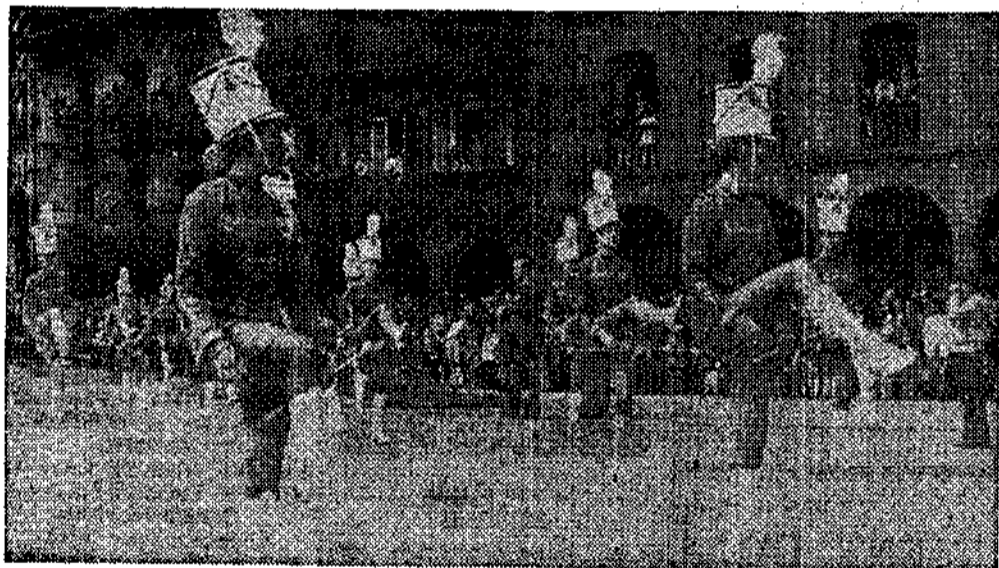
Uno de los grupos de «majorettes» durante el primer desfile de carrozas

adquirir tonos grises que por un momento hicieron presagiar que el desfile de las carrozas fuese suspendido, cosa que no ocurrió, a pesar del corto aguacero caído durante la celebración del mismo.