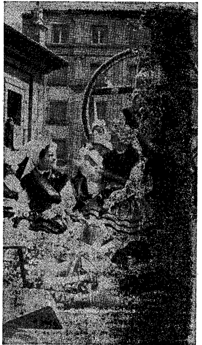
Las «reinas» y sus cortes desfilan en una carroza conjunta presentada por la SAFE.