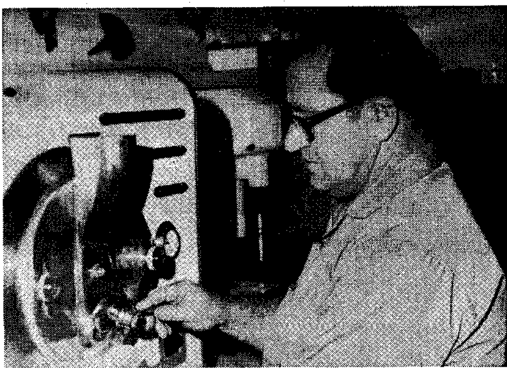
Peregrinos congregados en torno a la ermita de San Adriano