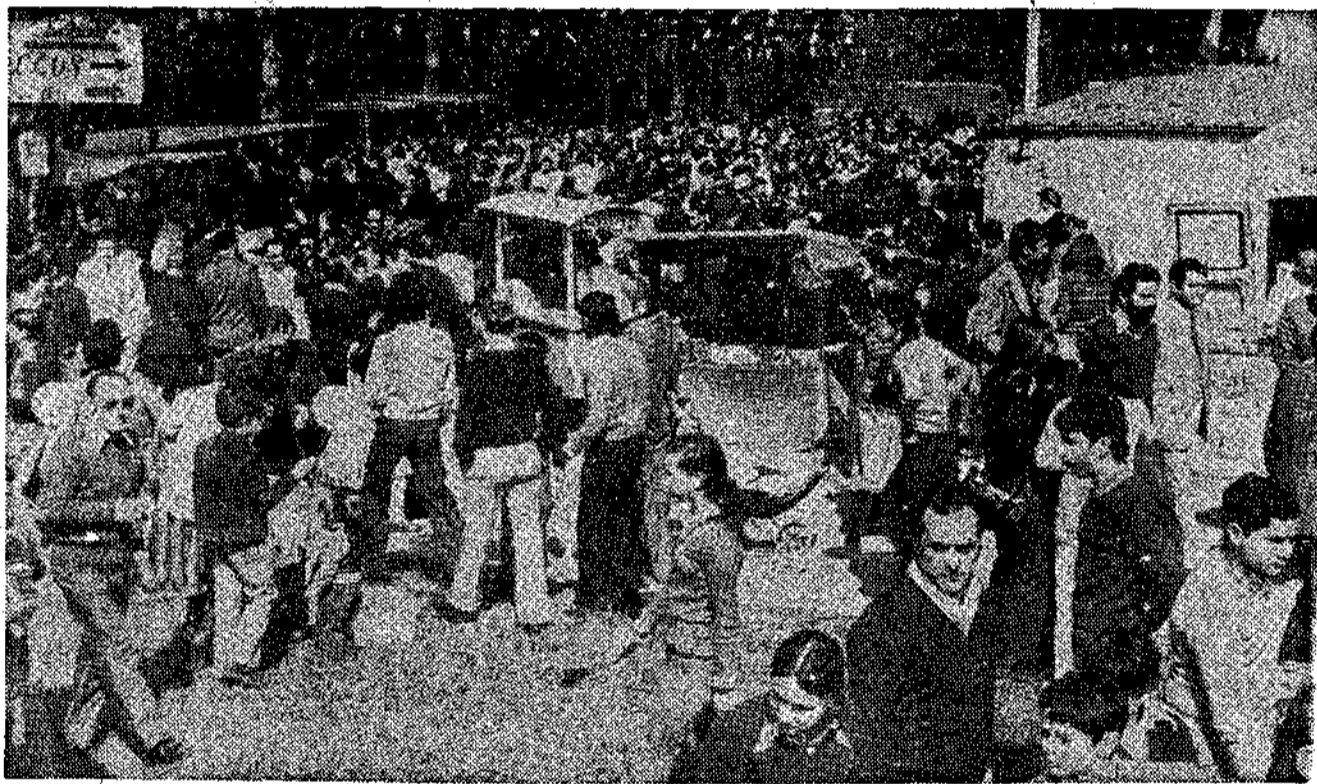
Gran animación ante los puestos de venta de los «bollos», marañuelas y la popular tómbola

Y mientras en las frías aguas del embalse se desarrolla el trofeo «San José Obrero» de submarinismo, a la altura del edificio del Club Náutico Ensidesa se lleva a cabo el «día nacional del piragüis-