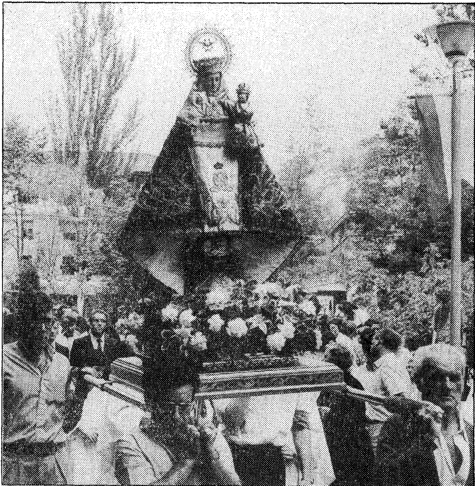
La Santina, en procesión, entra en la gruta después de permanecer durante la novena en la basílica de Covadonga