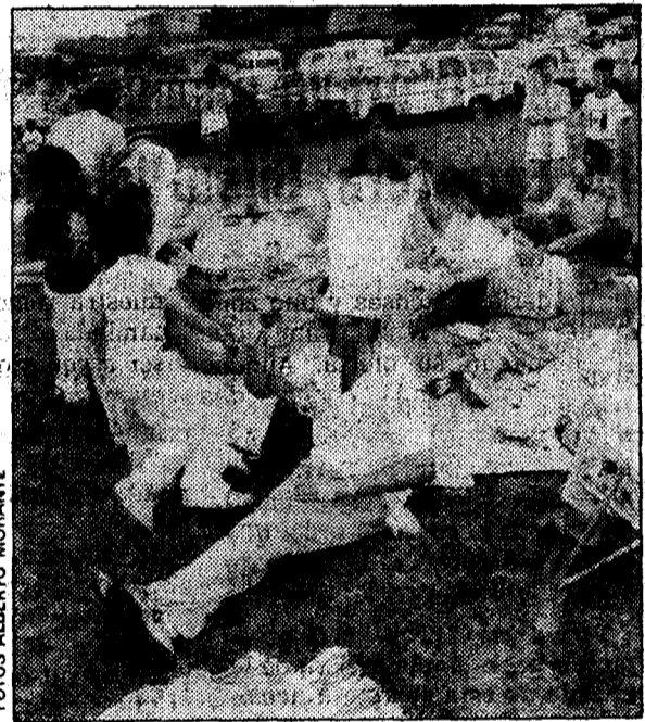
El día también fue una jornada campestre

Año tras año, la comisión de festejos de Naveces-San Adriano, con la colaboración del Ayuntamiento, organiza diversos actos para amenizar una jornada en la que el tiempo no suele acompañar. Aún así, un avilesino recorrió este año cerca de 20 kilómetros descalzo para llegar, finalmente, a San Adriano a presentar sus