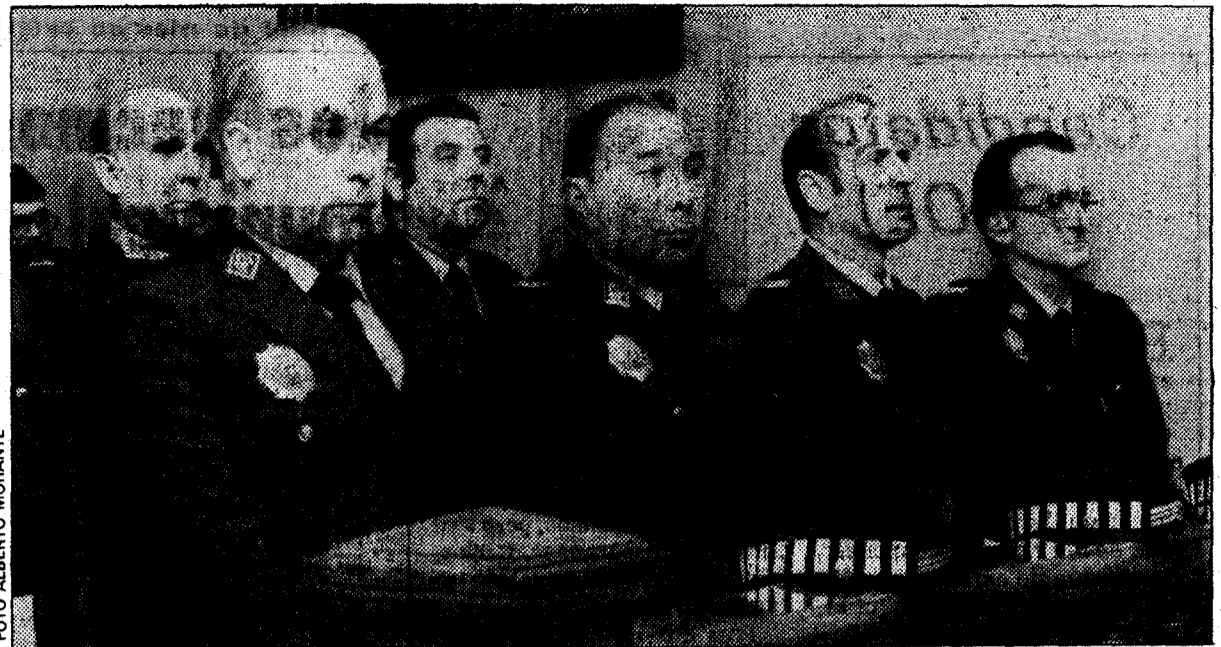
Las relaciones entre la Policía Municipal y el Ayuntamiento están marcadas en los últimos tiempos por constantes polémicas y enfrentamientos

Los dos nuevos expedientes se suman al omnipresente malestar