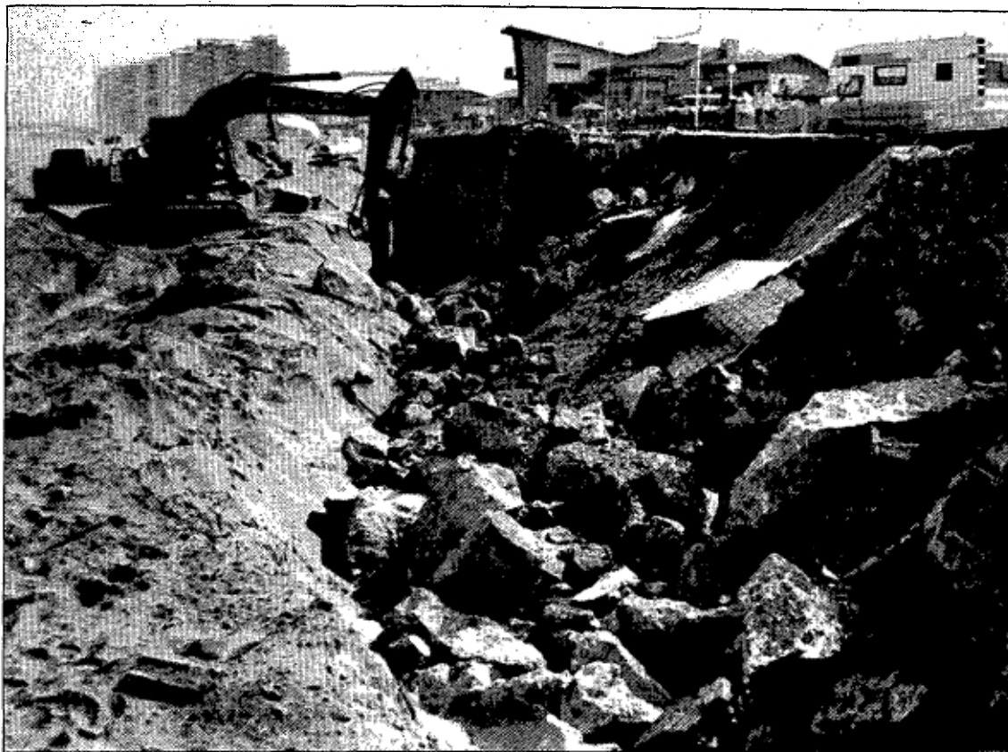
Las obras de reconstrucción del paseo de Salinas, que comenzaron a primera hora de ayer.

Los aspectos que más llaman la atención del proyecto a estos vecinos son el edificio central de servicios que se va a construir y los motivos marineros de las barandillas. «Al final, a lo mejor