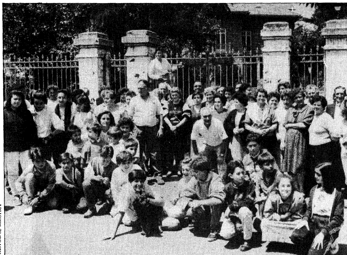
Los vecinos de Miranda parecen decididos a formar frente común y evitar que los toxicómanos que quieren rehabilitarse ocupen el caserón del pueblo frente al que posan.

Los vecinos del primer pueblo rechazan una comunidad terapéutica; los del segundo la consideran una vecindad estupenda