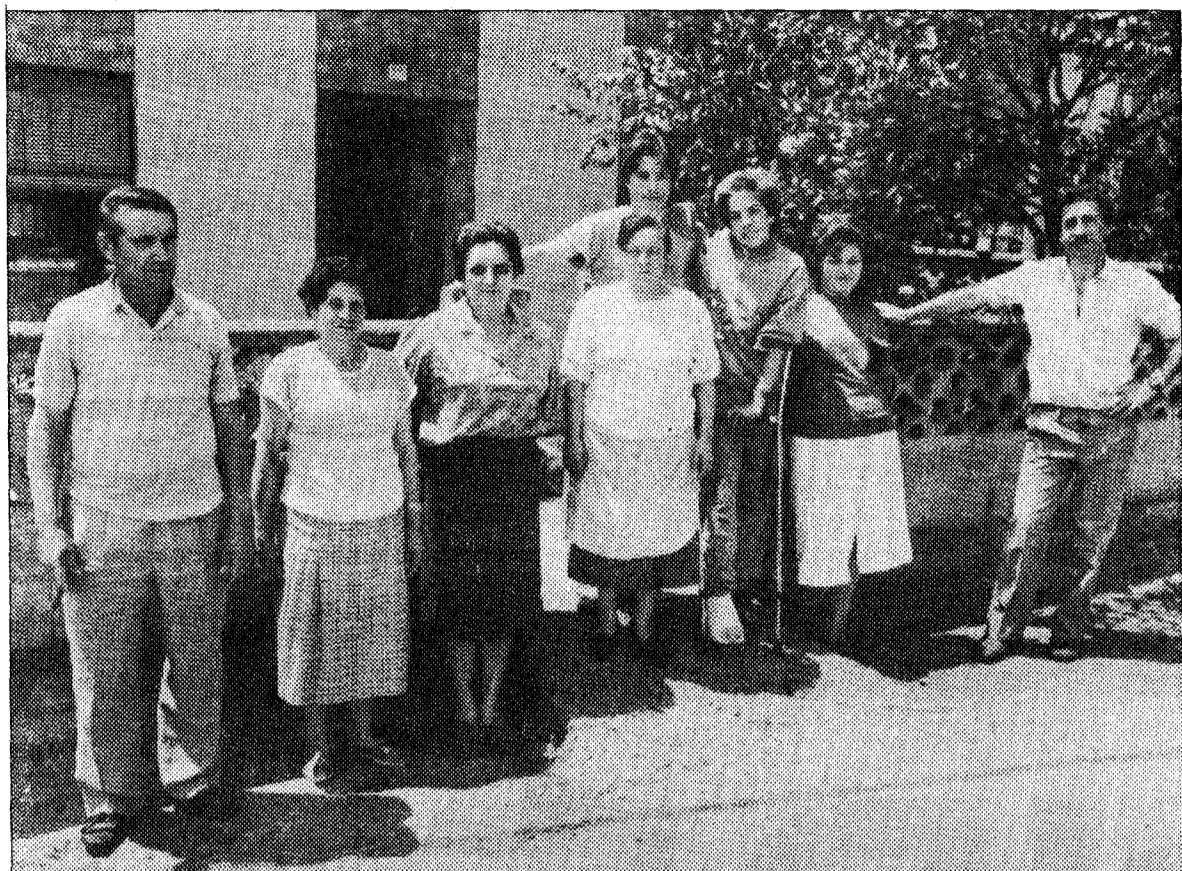
Los vecinos de Molleda de Arriba, un pequeño pueblo de Corvera, afirman que aunque al principio desconfiaron del centro para drogadictos, ahora sus inquilinos son «chicos estupendos»