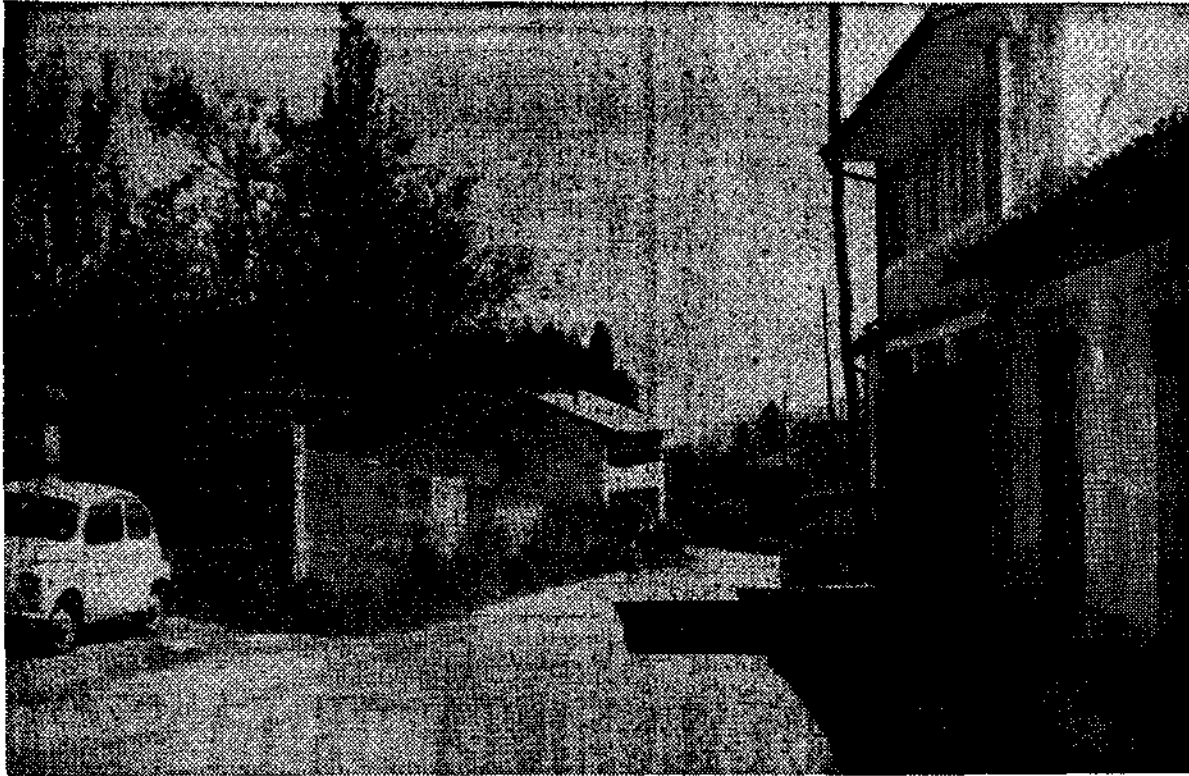
Entrada a Callezuela, capital del concejo