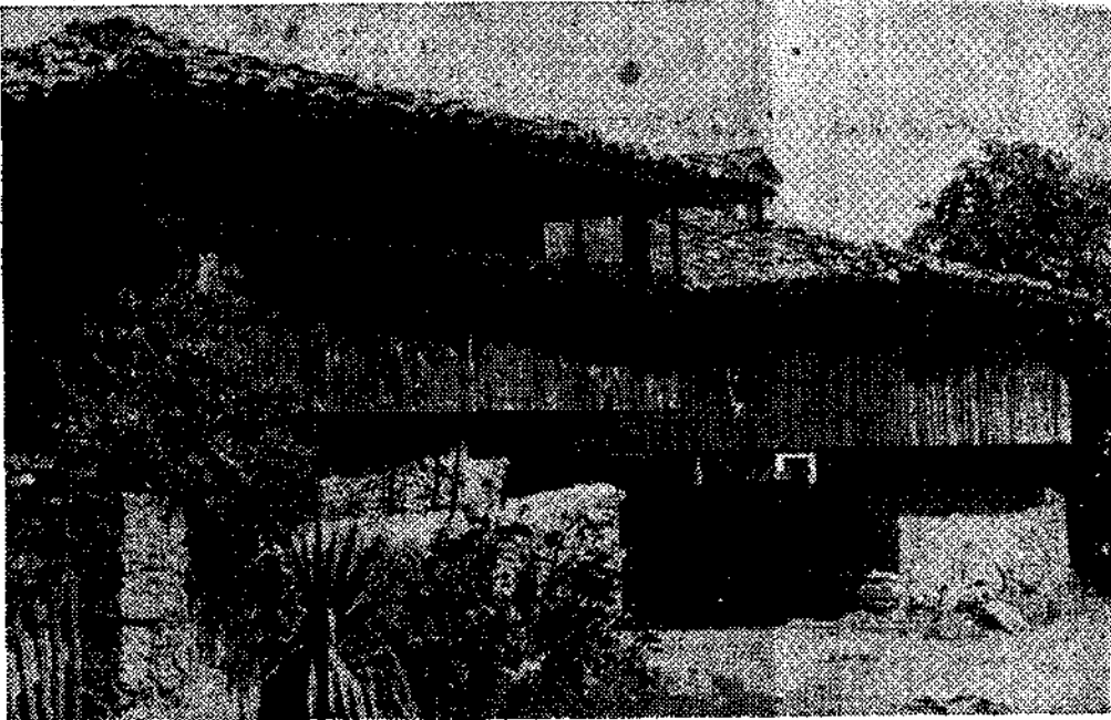
En Illas abunda el hórreo asturiano

concejo. Visitamos un lugar pintoresco y aparentemente olvidado por todo el mundo: se trata de la zona llamada La Barrera, donde no se sabe nada de agua corriente, a donde hay que llegar a través de un estrechísimo camino, lleno de obstáculos, por donde pasa un río limpiísimo.