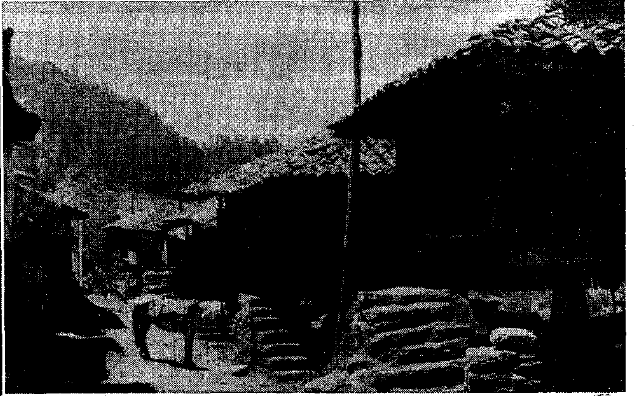
"La Barrera", un lugar casi ciudad