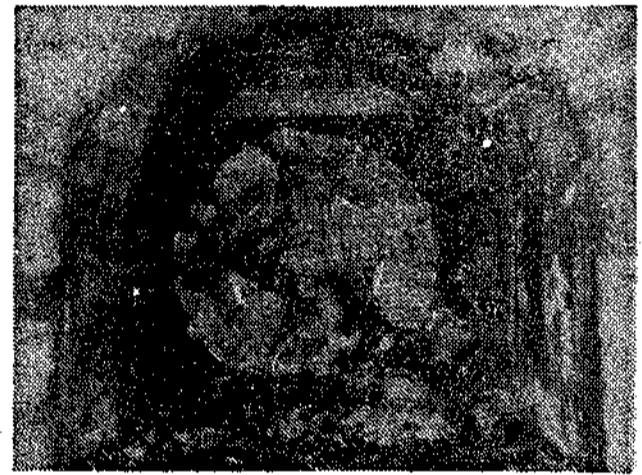
Cabeza perforadora del "Topo", aún sumergido en las oscuridades del túnel

«Robbin», está dotada de una cabeza cortadora equipada con 24 cortadores de disco y está accionada por cuatro motores eléctricos de 100 CV cada uno a través de reductores planetarios hasta una corona común. Los cangilones que se encuentran en la cabeza cortadora recogen los escombros y los depositan en una cinta transportadora que discurre por el interior de la máquina y que en laza con otra cinta colocada en cola para verter en los trenes que los sacan al exterior. El sistema de empuje consiste en dos cilindros hidráulicos con un recorrido de 1,10 m. capaces de ejercer un empuje de 229 toneladas sobre el frente, los cuales ofrecen su fuerza de agarre sobre los laterales del túnel. La característica flotante del mecanismo de agarre