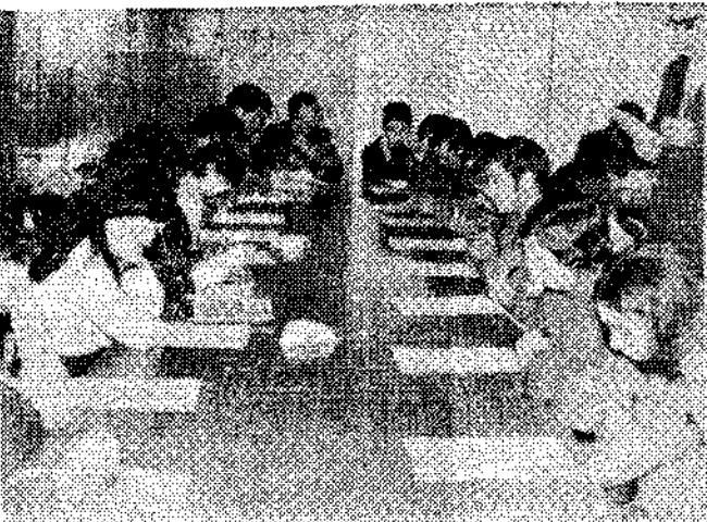
BIMENES.—Los alumnos cumplimentan las pruebas objetivas.

Como es natural, en Bimenes se imparten estas enseñanzas en la Casa Sindical en sus dos salas de juntas; sin embargo, en Nava al carecer la Organización Sindical de instalaciones con capacidad