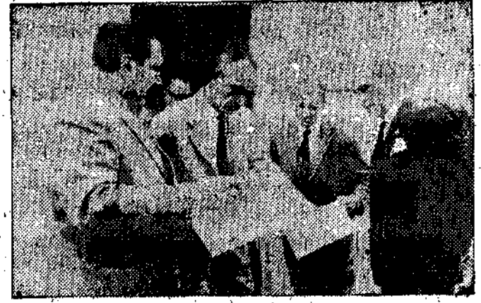
El gobernador civil y jefe provincial examina los planos de la traida de aguas a pueblos del concejo de Illas.