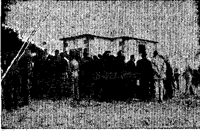
Depósito para la traida de aguas de Selgas

De nuestro redactor JUAN LUIS CABAL VALERO.