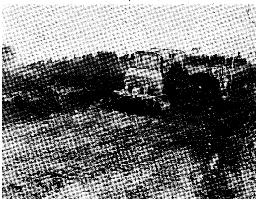
Abriendo la carretera que va a dar comunicación al pueblo de Quejo.