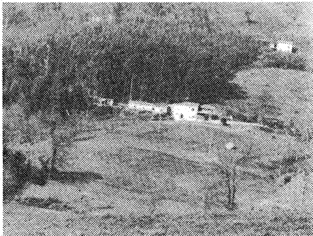
Apartados caseríos quedarán comunicados con su propio concejo

La carretera que comunica a Cogollo con su concejo atraviesa abundantes montes y debido a lo accidenta-