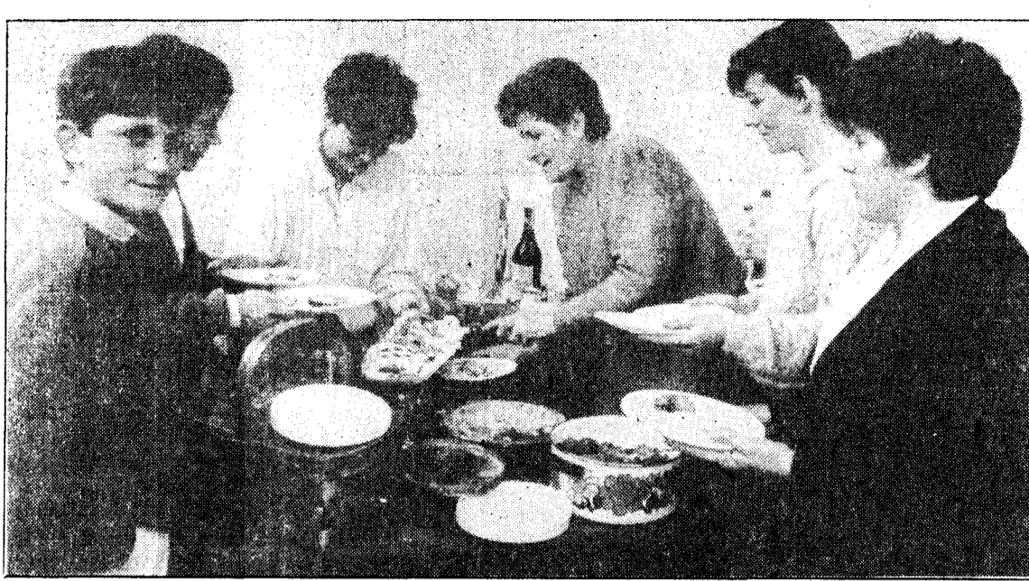
Un año más los postres fueron uno de los alicientes de las fiestas de San Juan de Mata, en Bueño