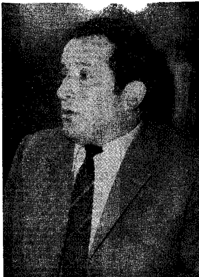
«Lo que hace falta —dice entre otras cosas el alcalde de Ribera de Arriba— es que el diálogo entre el Ayuntamiento y Administración, sea sincero y abierto»

—¿Cuánto hace de esto? —Aproximadamente unos cinco meses. —¿Y no supone usted las razones? —No, y no me explico este silencio, porque la única forma de solucionar las cosas es