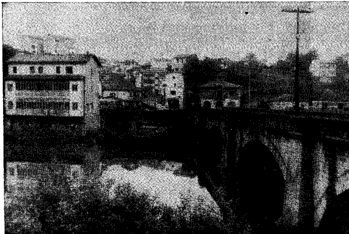
Panorámica general de Ribera de Arriba