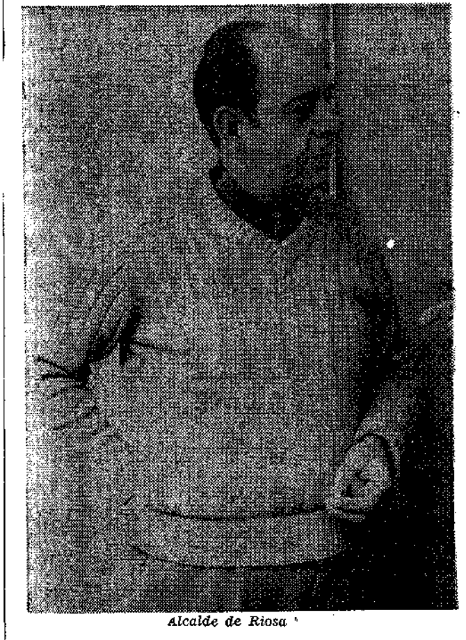
Alcalde de Riosa