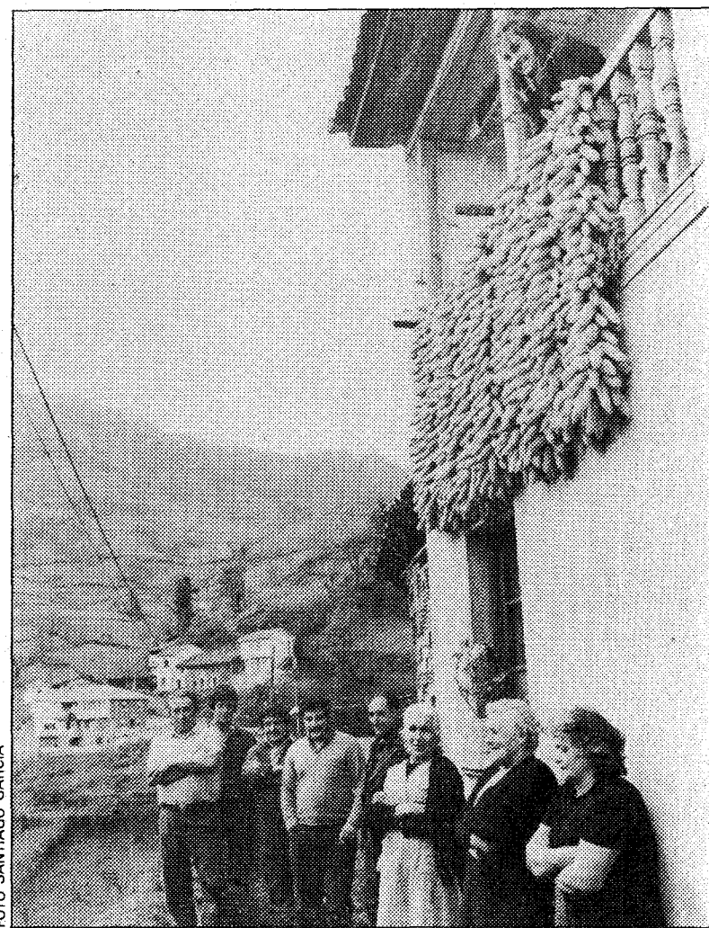
Ganaderos y habitantes del pueblo de Grandiella, con el Aramo al fondo, creen que si se hace el túnel acabará el concejo de Riosa