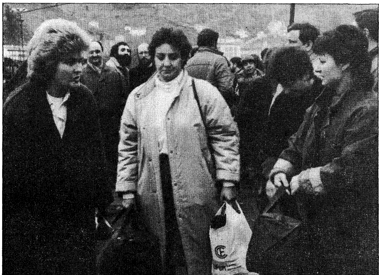
Las trabajadoras, que se incorporaban con la categoría de peones de exterior, optaron por volver a sus casas

la decisión de las grandes superficies comerciales de no abrir mañana. Página 15