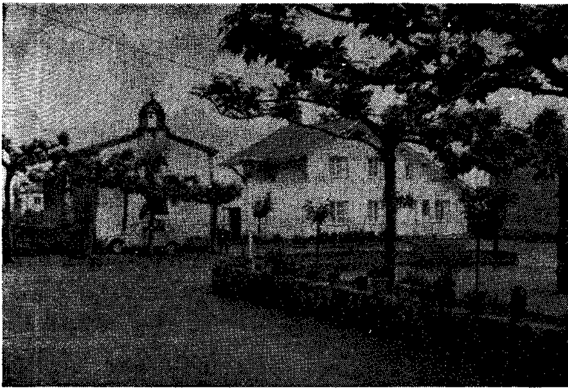
Un rincón del centro de La Vega, con la capilla del Carmen y casa del médico