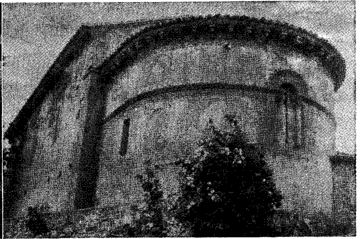
Abside de la iglesia de Santa María de Narzana