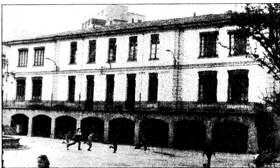
Los dos centros donde están repartidos los alumnos: el de la plaza Ramón y Cajal y el del Serrallo, al lado del río Nalón

La población escolar de Sotroñdío está distribuida en dos centros, lo que causa numerosos trastornos tanto a los profesores como a los alumnos. El edificio de la plaza Ramón y Cajal fue construido durante la dictadura de Primo de Rivera. Su estado es lamentable, con