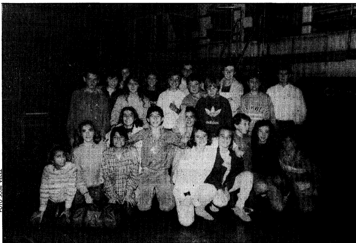
Visita a LA NUEVA ESPAÑA. Un grupo de alumnos de los colegios públicos «Al Andalus», de Cádiz, y «Castix», de Palma de Mallorca, visitaron ayer LA NUEVA ESPAÑA, dentro del programa organizado por el Ministerio de Educación y Ciencia, dirigido a las escuelas rurales

La inauguración no tiene todavía fecha conocida, pero próximamente se sabrá ésta ya que las obras están tocando a su fin.