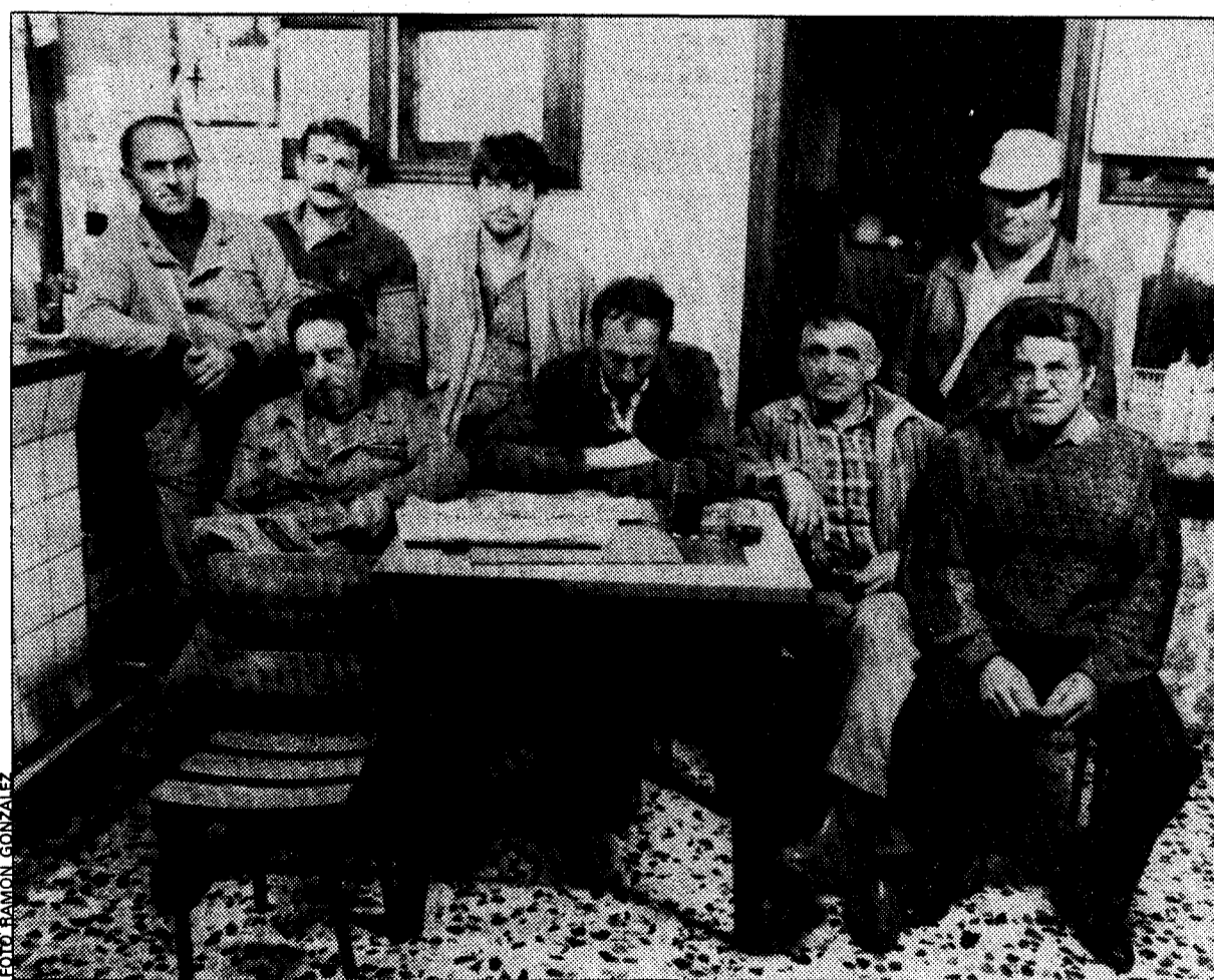
Catorce ganaderos de Siero y Sariego forman parte del centro de recría de Pico Fario

El total de novillas de raza frisona que se encuentran en la actualidad en el Pico Fario es de ciento cincuenta, con una media de dos años, y en estado de