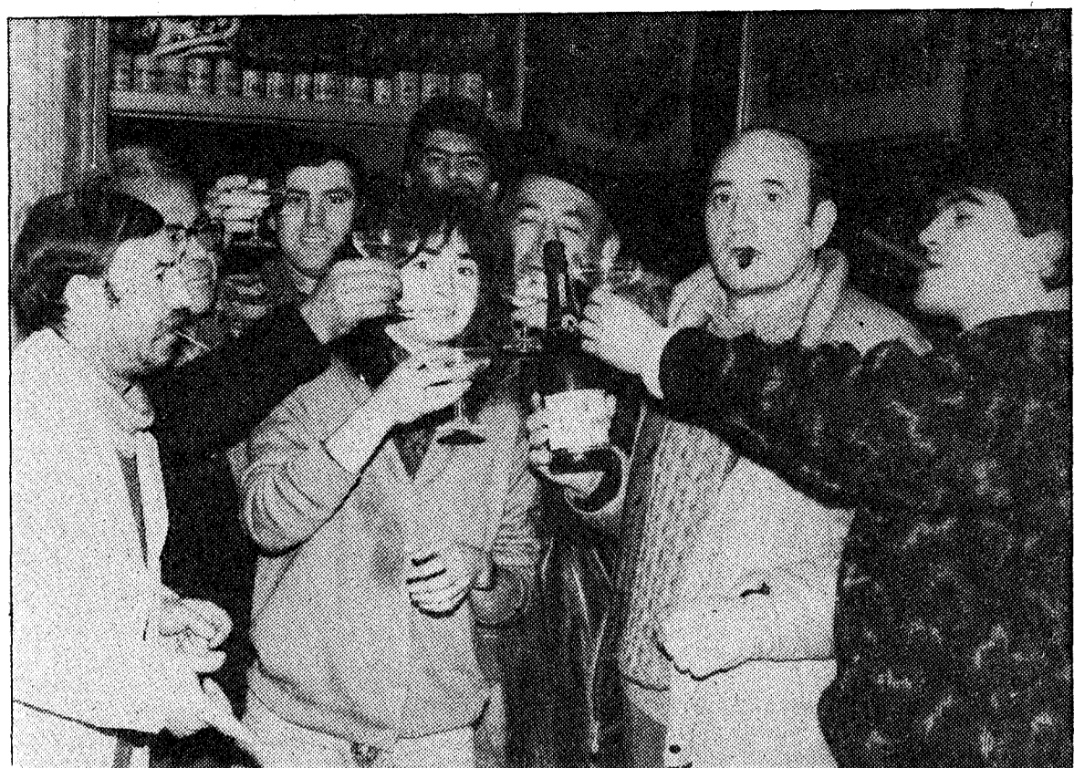
Los riosanos brindaron con champán por el éxito obtenido tras conocer el fallo del Tribunal Supremo