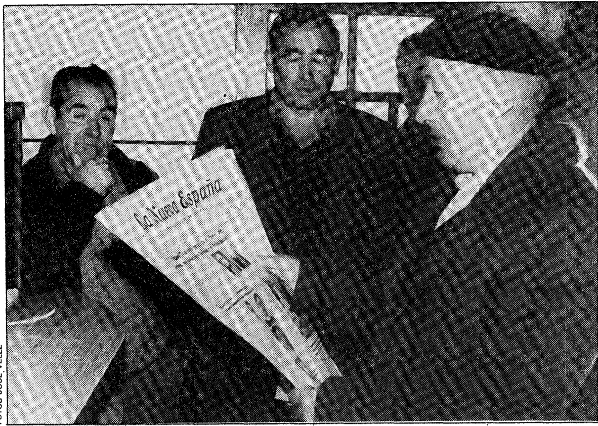
Los vecinos se despertaron con la noticia facilitada por LA NUEVA ESPAÑA