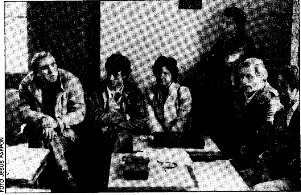
Los representantes de ocho asociaciones de Blimea, reunidos con LA NUEVA ESPAÑA en las polémicas escuelas, se sienten indignados con su Ayuntamiento

La permuta de unas escuelas y la situación del ambulatorio enfrenta al pueblo con la Corporación de San Martín del Rey Aurelio