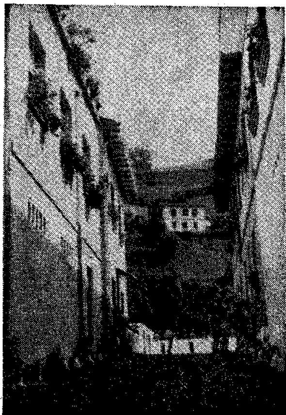
El Entrego. — (Servicio especial, por L.).

Sólo a unos metros de la carretera Oviedo-Campo de Caso, a su paso por El Entrego, saliendo hacia la derecha, se encuentra uno con el milagro. Porque milagro parece que Bédavo, el pueblo que hace unos meses era uno más entre el concierto de los que forman el amplio concejo de San Martín del Rey Aurelio, se haya convertido, de pronto, en el más cuidado de Asturias.