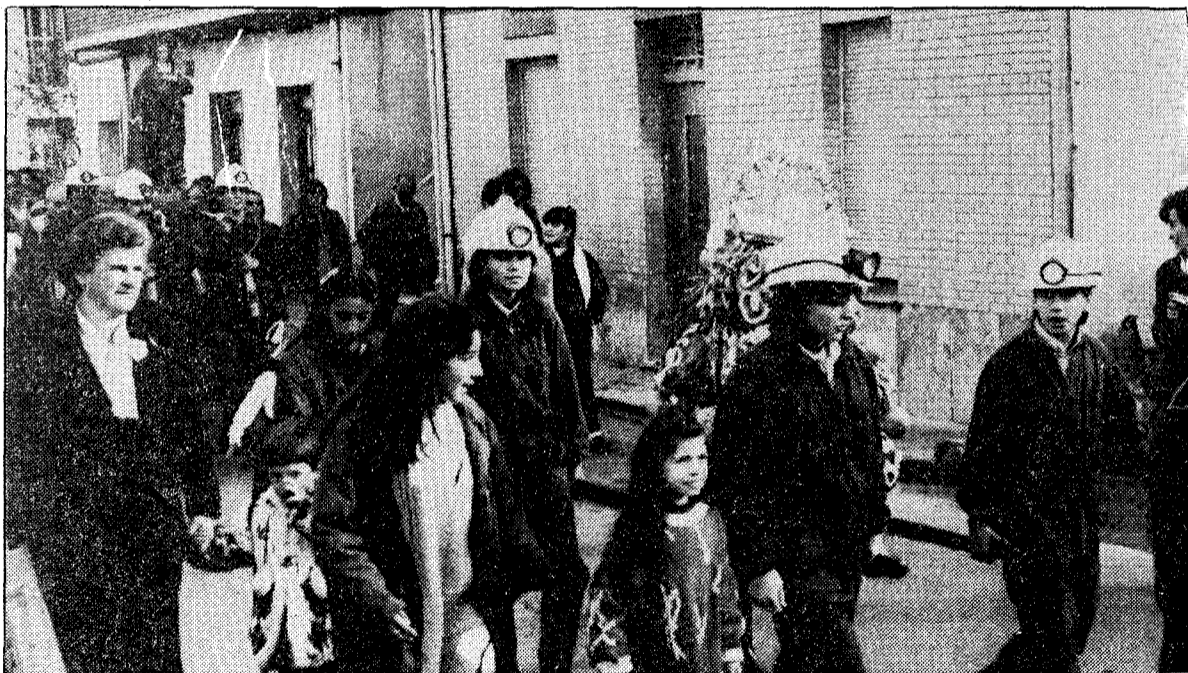
Un momento de la procesión que realizaron ayer los vecinos de Santa Bárbara. En primer término, niños vestidos de mineros con el ramo. Al fondo, la imagen de la patrona

El pueblo de Santa Bárbara es el único de la cuenca del Nalón que ayer celebró fiesta local en homenaje a Santa Bárbara, patrona de este pueblo y patrona