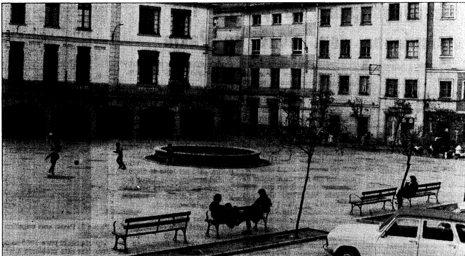
La plaza de Ramón y Cajal recuperará su antigua fisonomía con la construcción de un nuevo quiosco en su centro, en el lugar que ocupa la fuente