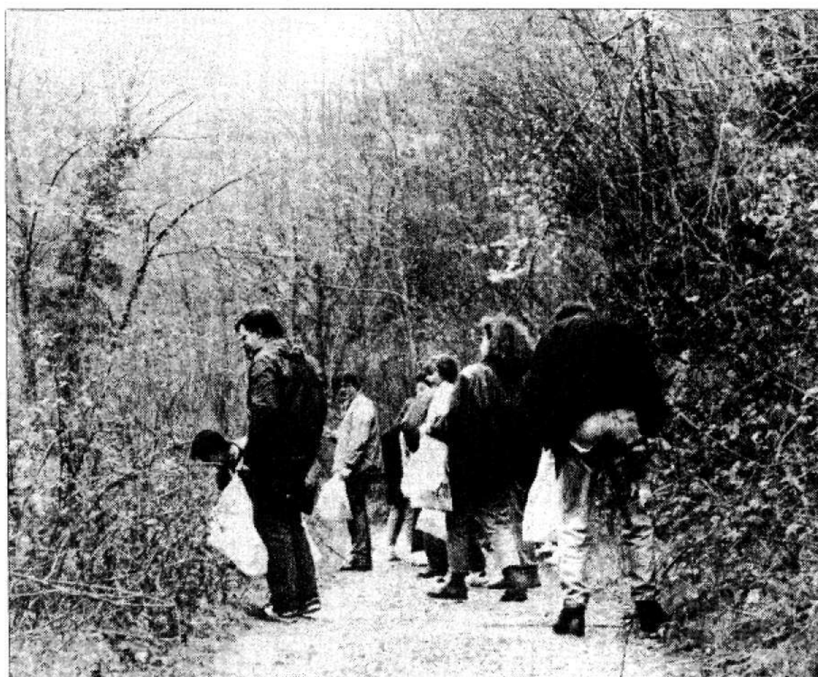
Un grupo de voluntarios dedicó parte de la jornada de ayer a limpiar la «Ruta del Alba». Los jóvenes confían en que la Administración se ocupe de la conservación de este paraje.