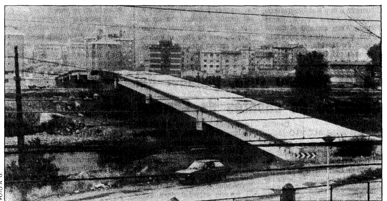
El puente de Siana ya es una realidad para eliminar el fatídico «cruce de la Perra»

A estas alturas de verano, se puede afirmar que el proceso lleva un ritmo muy aceptable y todas las previsiones apuntan su final para finales de septiembre o principios de octubre. La atención ciudadana está puesta en