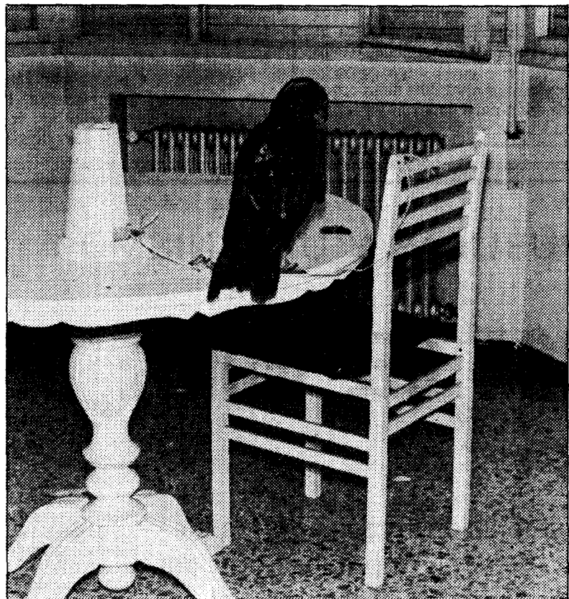
«Covadonga» se ha ido acostumbrando a la mesa a la que pertenece atada.