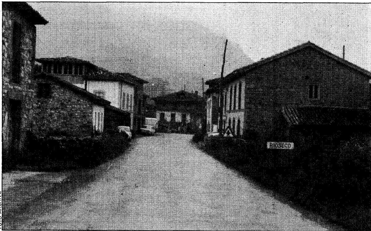
Riaseco, capital del concejo de Sobrescobio. En este municipio y en Caso no se recoge la basura desde mediados de la semana el servicio se realizaba con un tractor.

Los municipios de Caso y Sobrescobio solicitarán información de Cogersa con vistas a una posible integración en el consorcio. La aparición de serios problemas en la recogida de basuras en ambos concejos ha motivado que sus alcaldes estudien una posible integración que solucione el servicio de recogida de basuras. Desde mediados de esta semana, tanto en el concejo de Caso como en el de Sobrescobio se ha suspendido el servicio de recogida de basuras que se venía realizando. Ambos municipios carecen de un servicio propio de limpiezas y recogidas de residuos sólidos. Por este motivo estas labores eran realizadas por particulares que con material propio recogían las basuras en las principales localidades una o dos veces por semana. Un contrato contraído con el Ayuntamiento les garantizaba el pago de una cantidad que rondaba las tres mil pesetas diarias, lo que con una periodicidad semanal en el servicio suponía unos ingresos de casi doscientas mil pesetas anuales.