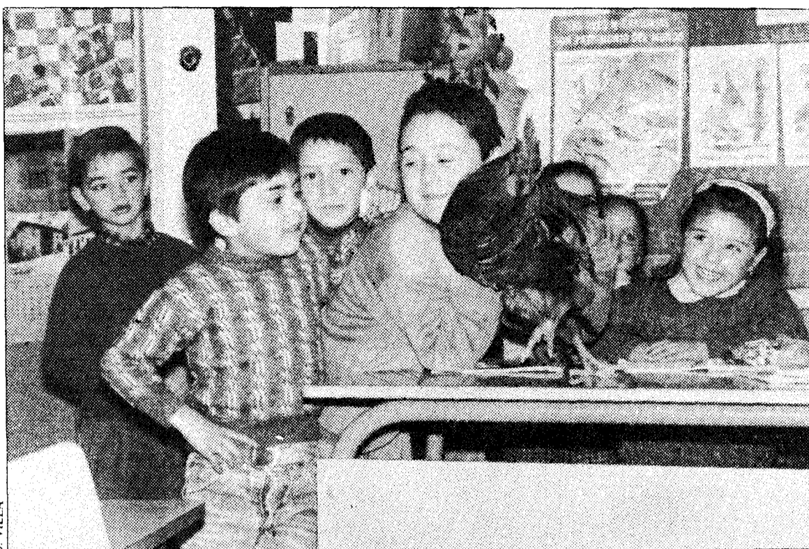
El gallo se convierte por un día en todo un amigo para los niños.